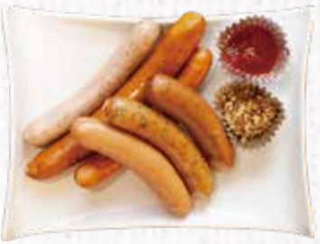
28 そらくもソーセージ 6種盛り合わせ 1,800円+税