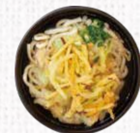
19 野菜かき揚げうどん 720円+税