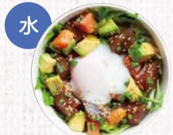
13 高知マグロとアボカドの ハワイ風ボキ丼 1,000円+税