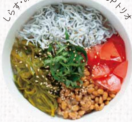
3 あいのりねばり丼 600円+税