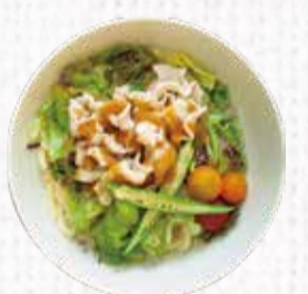
18 サラダうどん 750円+税