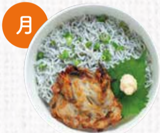
11 安芸生しらすの ふわふわかき揚げ丼 750円+税