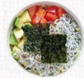
5 安芸釜あげしらすの 彩りサラダ丼 650円+税