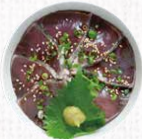
7 高知わら焼き カツオタタキ丼 1,200円+税