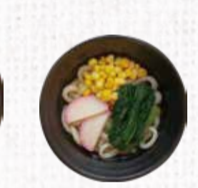
20 キッズうどん 390円+税