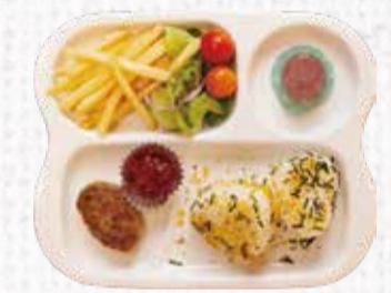
21 キッズプレート 500円+税