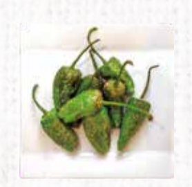
26 遠野パドロン の素揚げ 500円+税