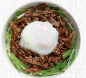
10 いわて短角牛の 牛すじ丼 950円+税