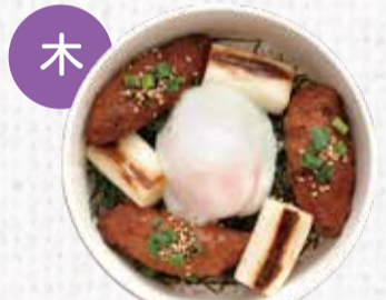
14 広島ハーブ鶏の つくね丼 850円+税