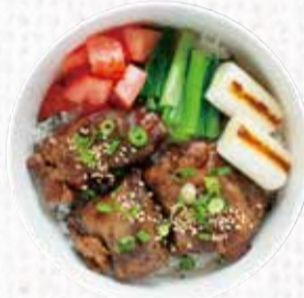
9 瀬戸内六穀豚のやわらか なんこつ煮込み丼 750円+税