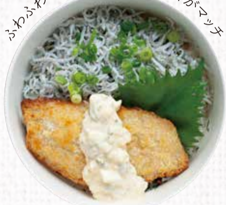
2 安芸釜あげしらすと瀬戸内白身フライ丼 650円+税