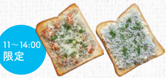
22 安芸釜あげしらす トースト(ピザ風) 300円+税