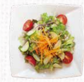
24 サラダ 400円+税