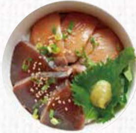
8 安芸水産監修 2色漬け丼(カツオ・ブリ) 1,200円+税