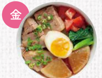
15 石川県能登豚の角煮丼 850円+税