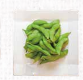
25 枝豆 350円+税