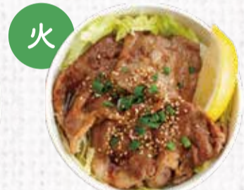
12 瀬戸内六穀豚の 塩麹漬けしょうが焼き丼 850円+税