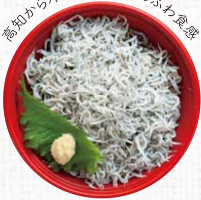
1 安芸 釜あげしらす丼 500円+税