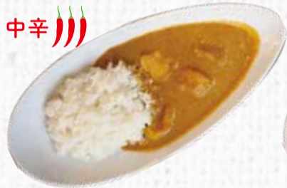
16 イエロースパイスカレー 700円+税