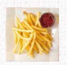
27 ポテトフライ 300円+税