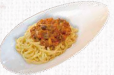
17 野菜たっぷり もちもちトマトパスタ 720円+税