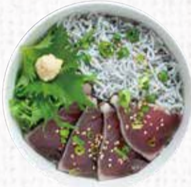
6 高知わら焼きカツオと 釜あげしらすのあいもり丼 850円+税